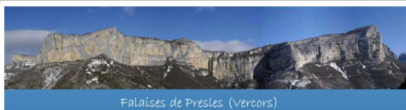
Falaises de Presles (Vercors)

Beaucoup d'entre vous connaissent le beau site d'escalade de Presles dans le Vercors. Aidez nos amis grimpeurs de la région.