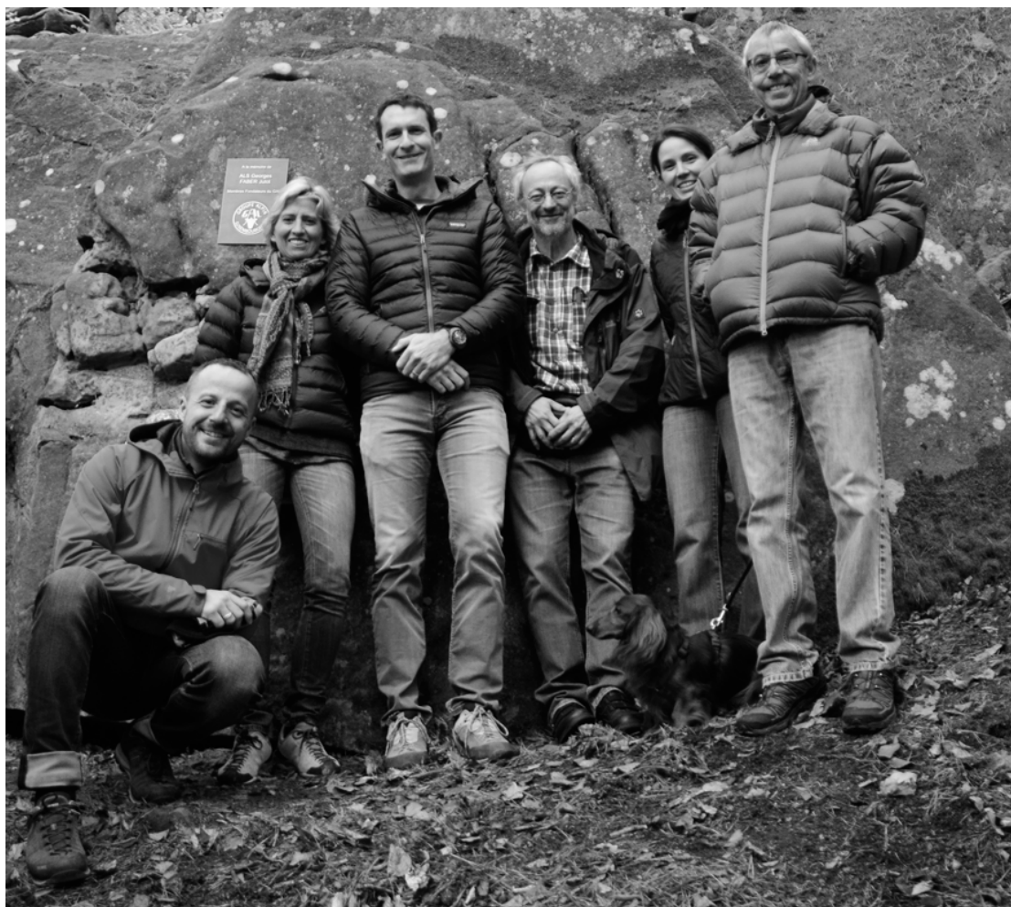
Groupe Alpin Luxembourgeois asbl